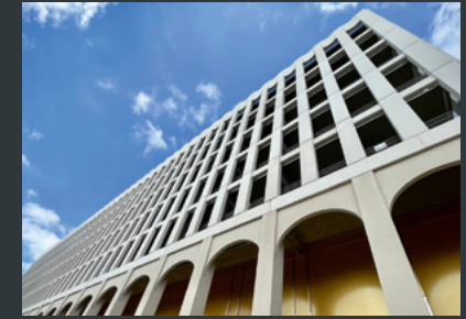
Fernbusterminal Bremen

„Ein wichtiger Infrastrukturknotenpunkt, der sinnvoll geplant, rasch gebaut und ebenso intelligent wie wirtschaftlich betrieben wird. Was will man mehr?“