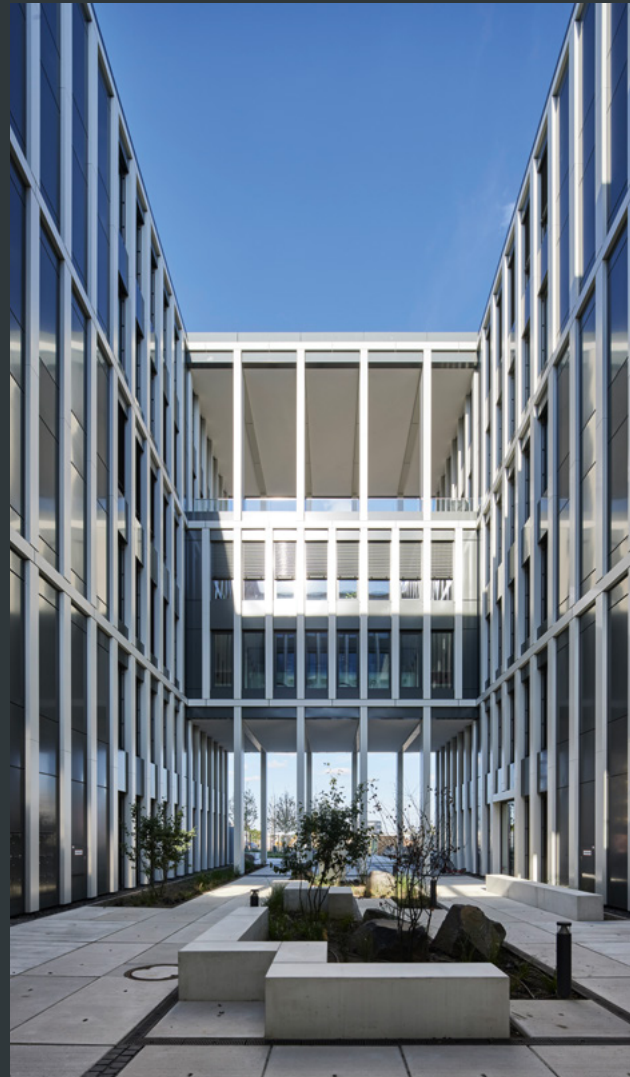
Bürogebäude, Hallen, Retail, Parkhäuser

Unsere Real Estate Services. So vielfältig wie Ihr Portfolio.